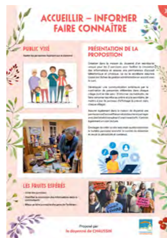
Proposition du doyen de Chausain